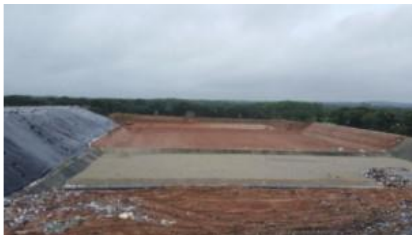
C10 avec drainant