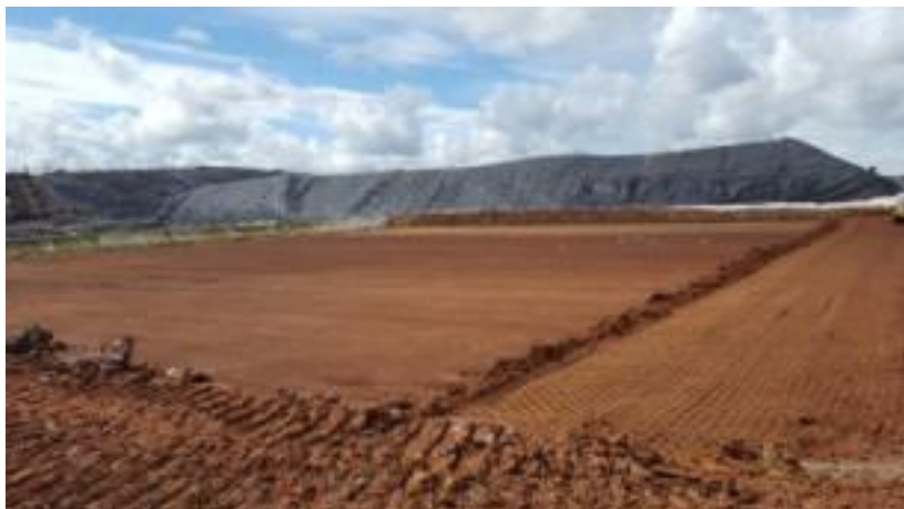
Mise en place argile 10^{-9} \text{ m.s}^{-1} C10 pour BSP