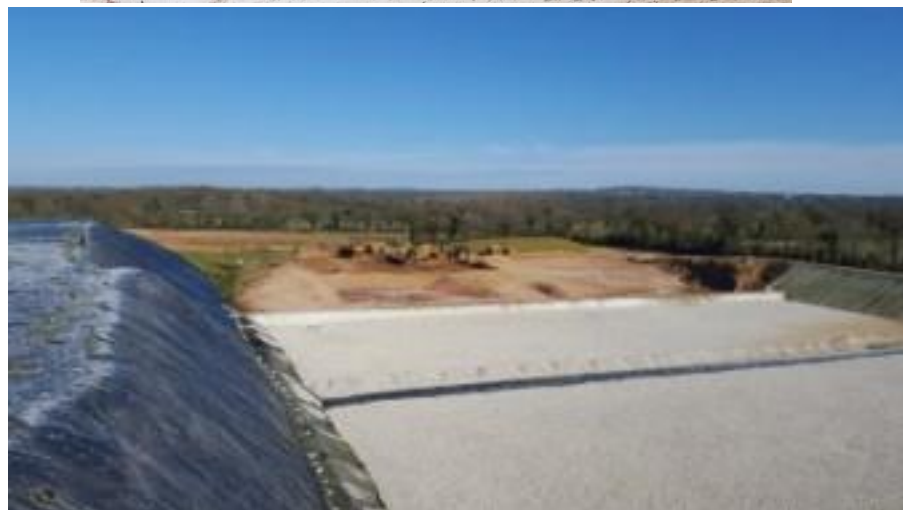
C11 avec drainant