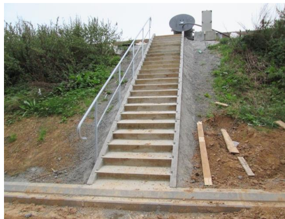
Escalier accès puit lixiviat