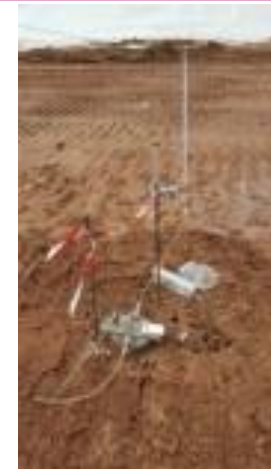
Essai perméabilité à l'infiltromètre