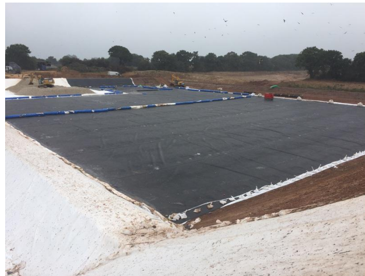
Pose géomembrane et géotextile anti poinçonnement