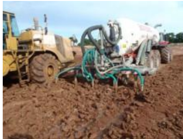
Correction hydraulique BSP