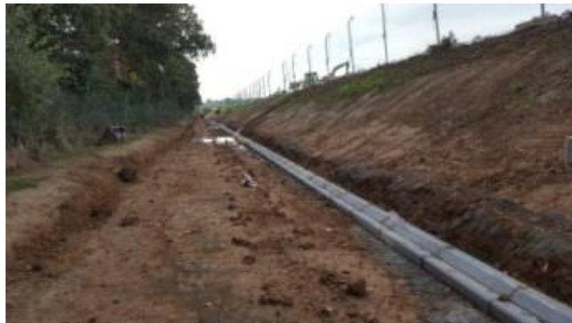
Assainissement de surface