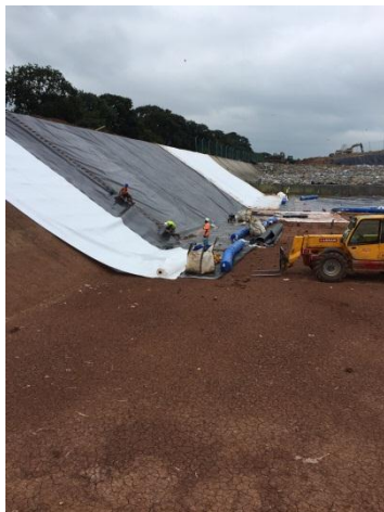
Pose géomembrane et géotextile anti poinçonnement