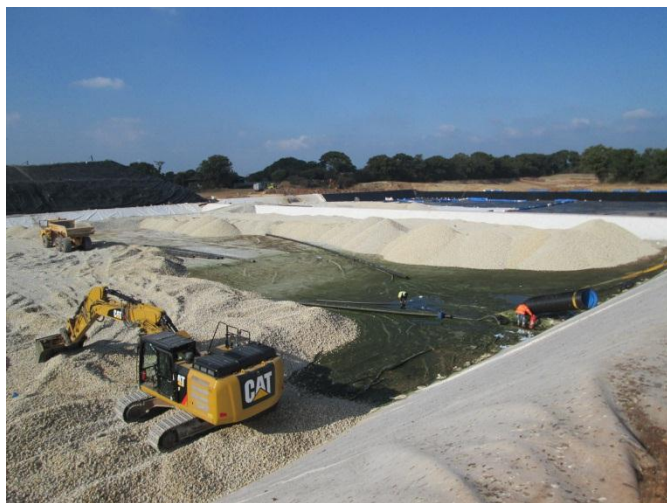
Mise en place matériaux drainant